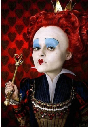
Şekil 5 Kötü Kalpli Kraliçe