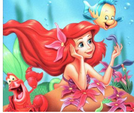
Şekil 2 Küçük Deniz Kızı