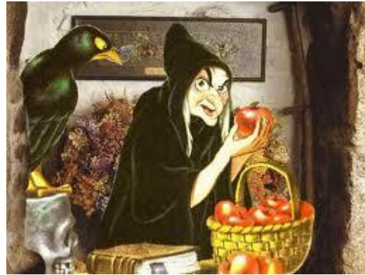
Şekil 6 Kötü Kalpli Cadı