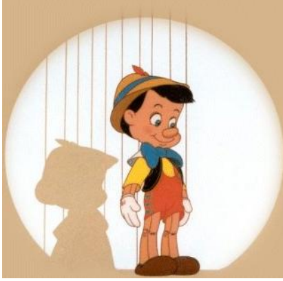
Şekil 1 Pinokyo